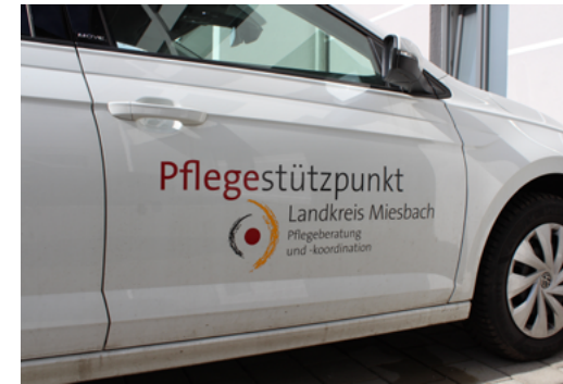
Das Team des Pflegestützpunktes ist auch mobil und kann für Beratungstermine Hausbesuche machen.

Bereits seit einem Jahr gibt es nun den Pflegestützpunkt im Landkreis Miesbach, der von den gesetzlichen Kranken- und Pflegekassen Bayerns sowie dem Bezirk Oberbayern und dem Landkreis getragen wird. Er ist als Anlaufstelle für all diejenigen gedacht, die sich kostenfrei und individuell zu allen Fragen rund um das Thema Pflegebedürftigkeit beraten lassen möchten.