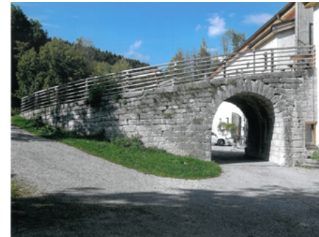
Tennenauffahrt bei Gut Kaltenbrunn.

Tegernsee hat seine bäuerliche Struktur längst verloren. Es gibt aber bei einigen Bauern und Anwesen noch „Denabrucken“. Genauso bei kleineren Anwesen, obwohl sie keine Landwirtschaft mehr betreiben. Vielen sagt heute der Name „Denabruck“ nichts mehr. Man sieht sie schon noch, die „Denabruck“, Dena heißt im Hochdeutschen Tenne und ist die Bezeichnung für den Scheunenboden. Der Denaberg wiederum ist die Auffahrt zur Tenne und die Denabruck das Übergangsstück vom Denaberg zum Dena.