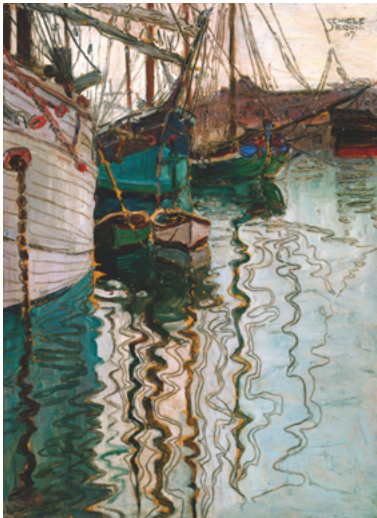
Egon Schiele (1890 -1918)

Die Sonderausstellung (läuft bis 20. Juli 2025) bringt das Meer in die Berge: Über 65 Werke – Gemälde, Aquarelle und Zeichnungen vom 17. Jahrhundert bis zur unmittelbaren Gegenwart – offenbaren die große Faszination und ungebrochene Anziehungskraft des Ozeans, die Künstlerinnen und Künstler immer wieder zu neuen Interpretationen inspiriert. Es ist eine große Ehre, dass in den Räumen des Museums Bilder aus Privatbesitz in dieser Qualität zu sehen sind.